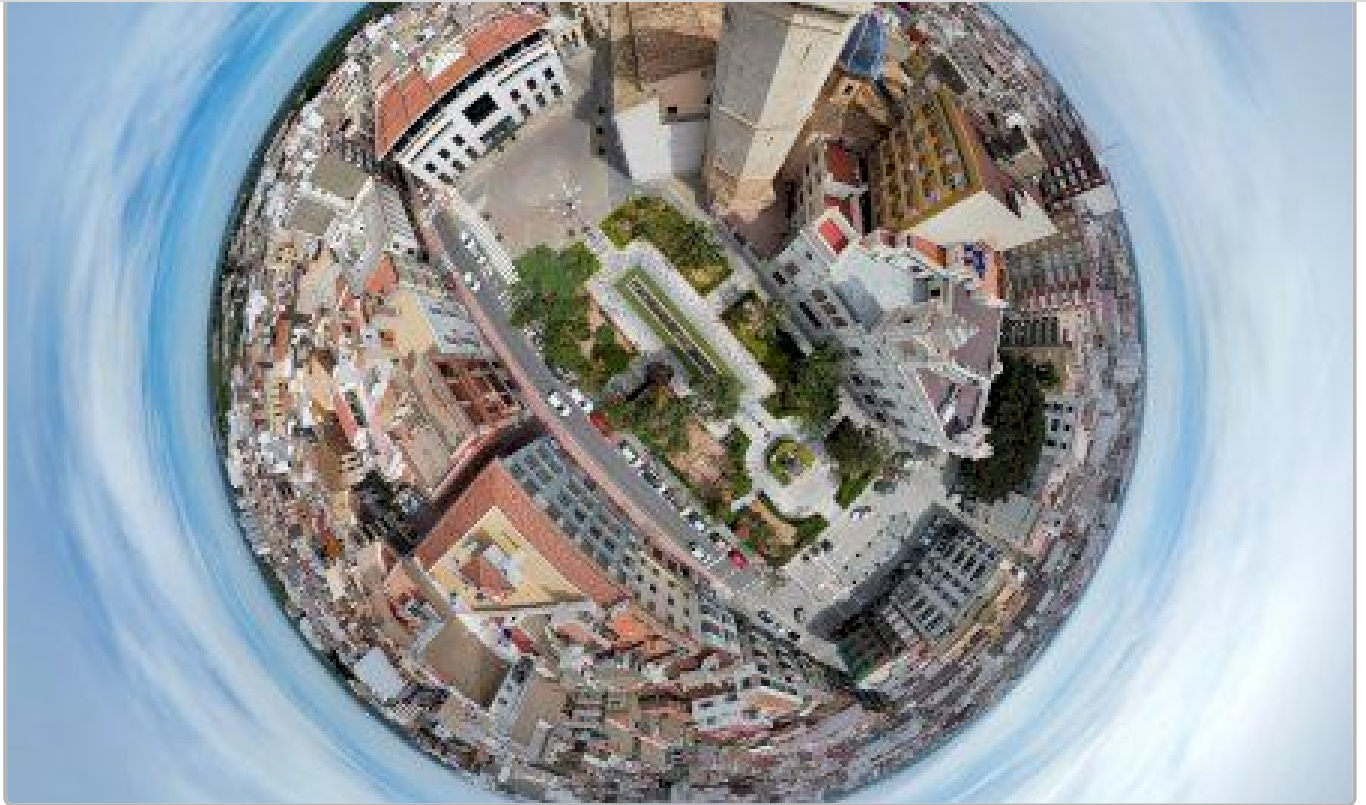
Burriana a vista de pájaro, la historia de un holandés enamorado de la ciudad